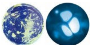
Eau morte déstructurée